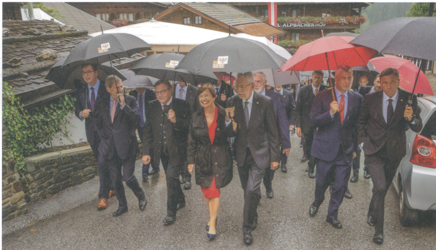
POL Opening