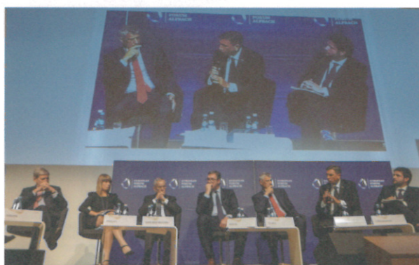
POL Opening