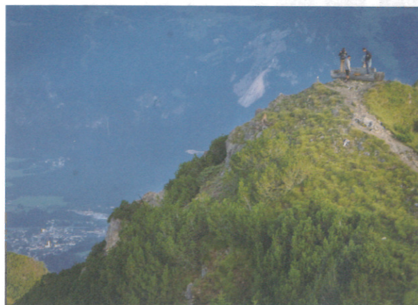
Morning Hike

與瑞士達沃斯「世界經濟論壇」齊名的奧地利歐洲論壇 (EFA) 成立於 1945 年，每年邀請各界領袖主講，並與來自世界各地的青年深度交流。龍應台文化基金會是 EFA 第一個亞洲夥伴。